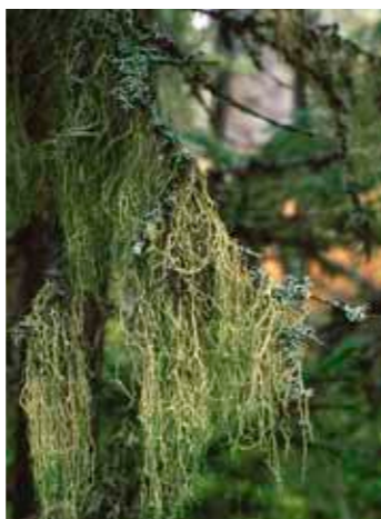
Den glesa tallurskogen på hållmarkerna (mitten och omslaget) är typisk för Tyresta. I sumpskogen häckar sparvhöken (t v). Ringlaven (t h) är en av de arter som är utrotningshotade i Sverige på grund av bristen på gammal orörd skog.