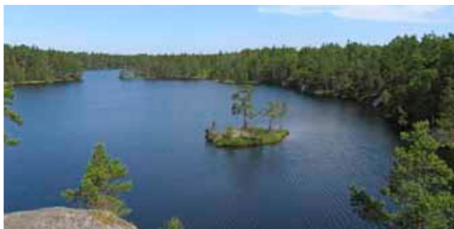
I en stor sprickdal ligger den vildmarkspräglade Årsjön.

Vissa av hållmarkernas grova tallar är över 400 år gamla och visar att Tyrestaskogarna fått sköta sig själva under lång tid. Idag kan