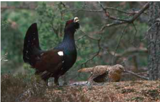
Tjäderspel i den gamla hällmarkstallskogen.