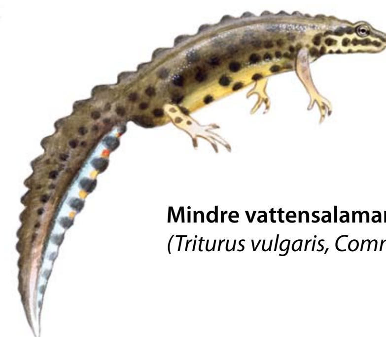
Mindre vattensalamander, vattenform, hane och hona. ( Triturus vulgaris , Common Newt)