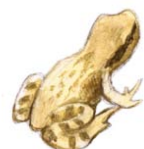
Vanlig groda, liten unge och fullvuxen. ( Rana temporaria , Common Frog)