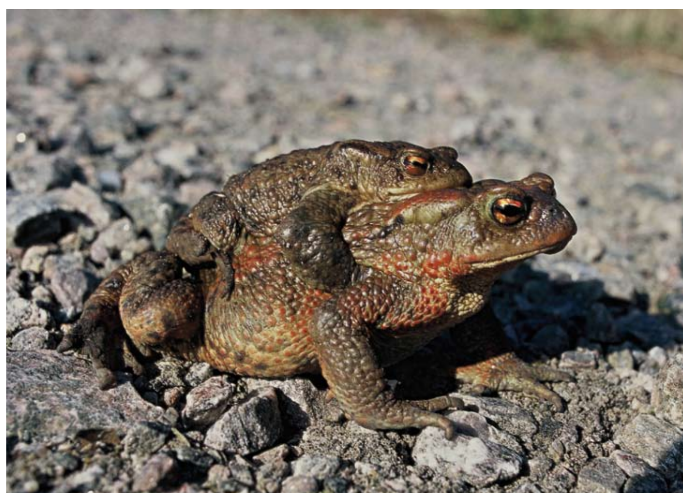
Farlig väg över bilväg. Paddhanen kan rida på en hona flera hundra meter till vatten för att leka.