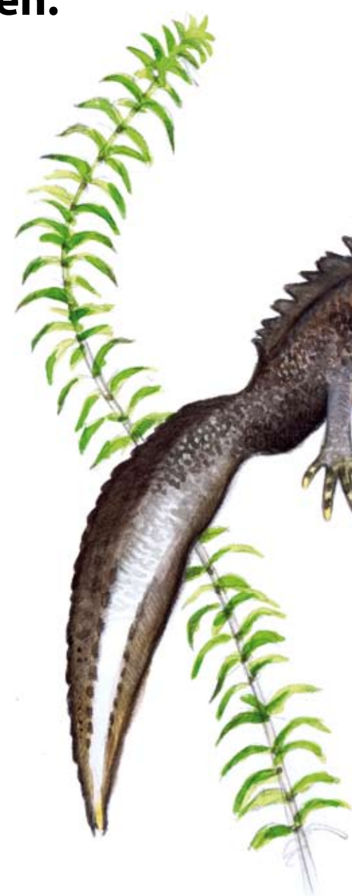
Större vattensalamander, vattenform, hane och hona. ( Triturus cristatus , Northern Crested Newt)

Resten av året kryper djuren på land, tappar sin kam och lever undanskymt.