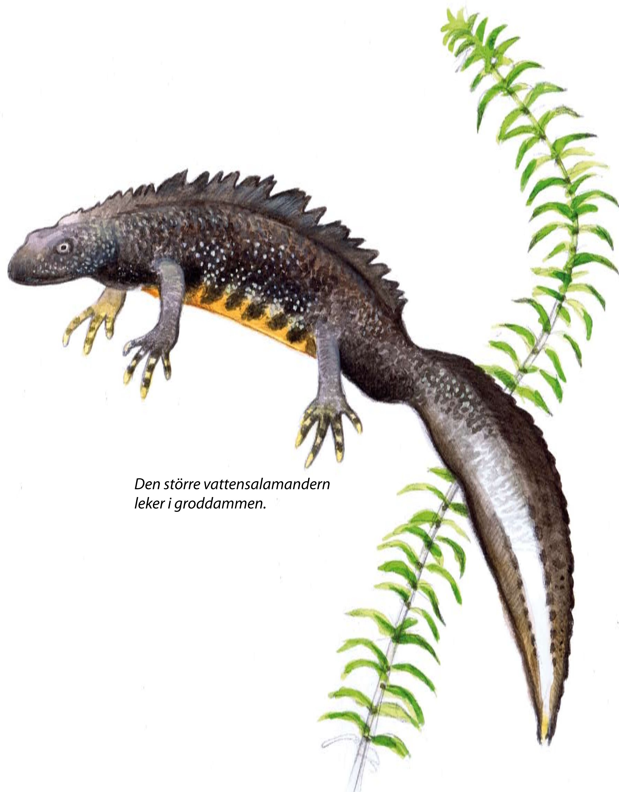
Den större vattensalamandern leker i groddammen.

Alla groddjur är fridlysta i hela landet. Vi vill att Tyresta ska vara ett paradis för groddjur. Därför vårdar vi groddammen och andra vatten. Vi låter stenrösen och rishögar i skogen vara kvar – där kan groddjuren övervintra. Och om grodorna trivs, trivs nog också vi!