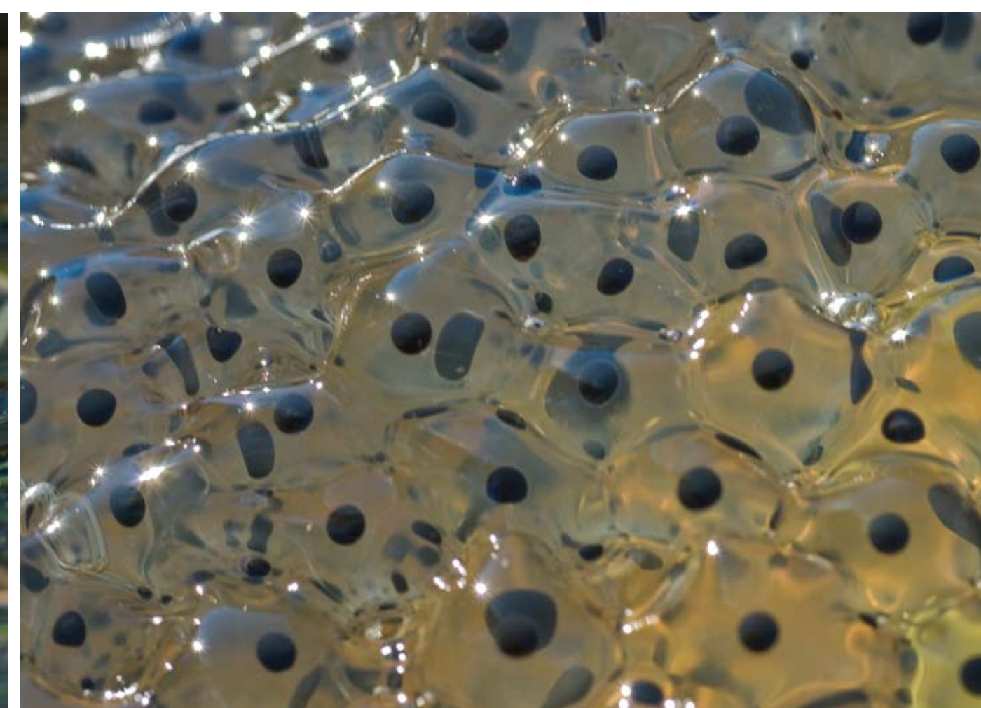
En groda kan lägga tusen romkorn. På tre-fyra månader har det blivit små grodor av rommen.