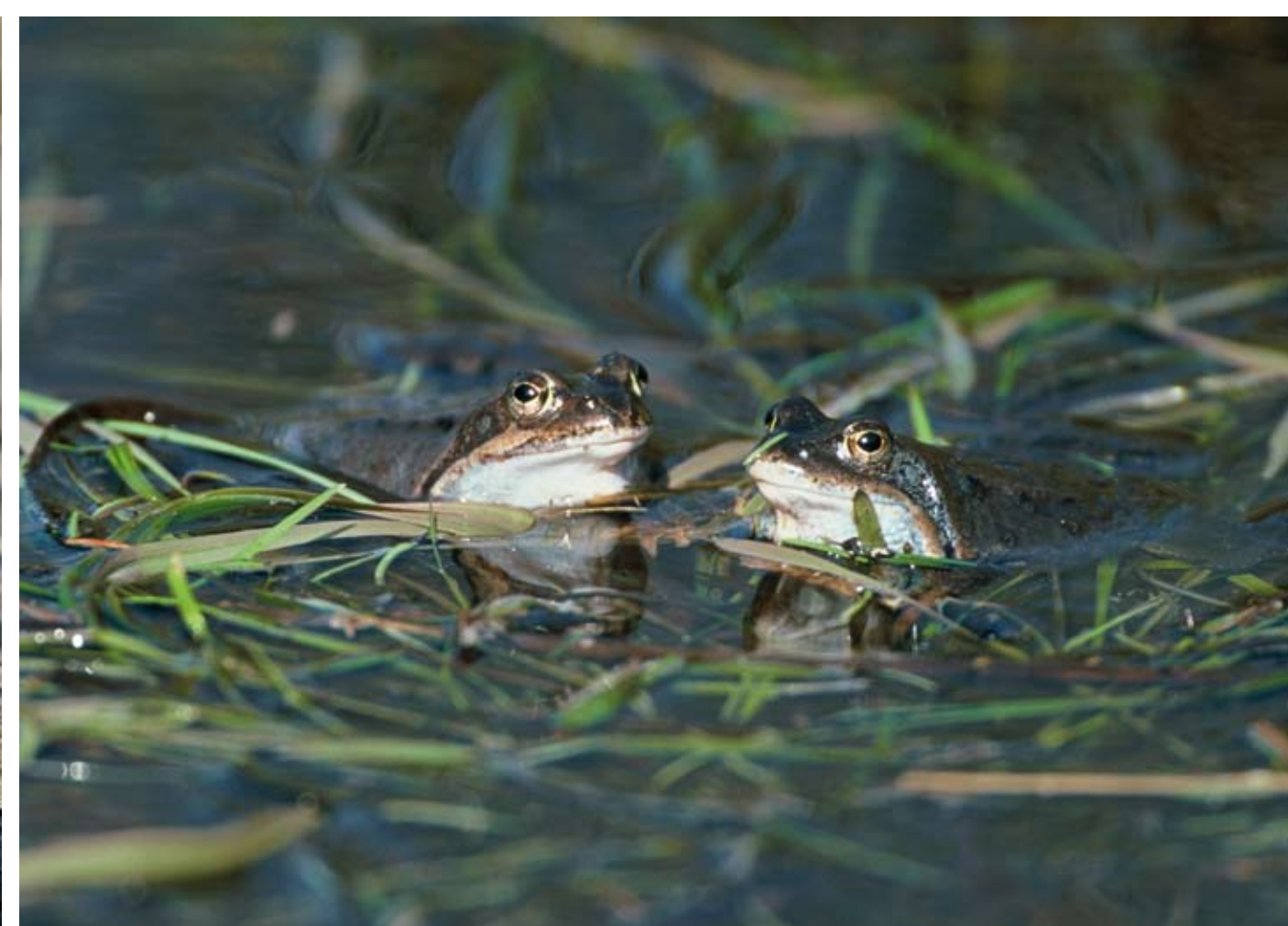
Grodlek. Den vanliga grodan kuttrar i kör.