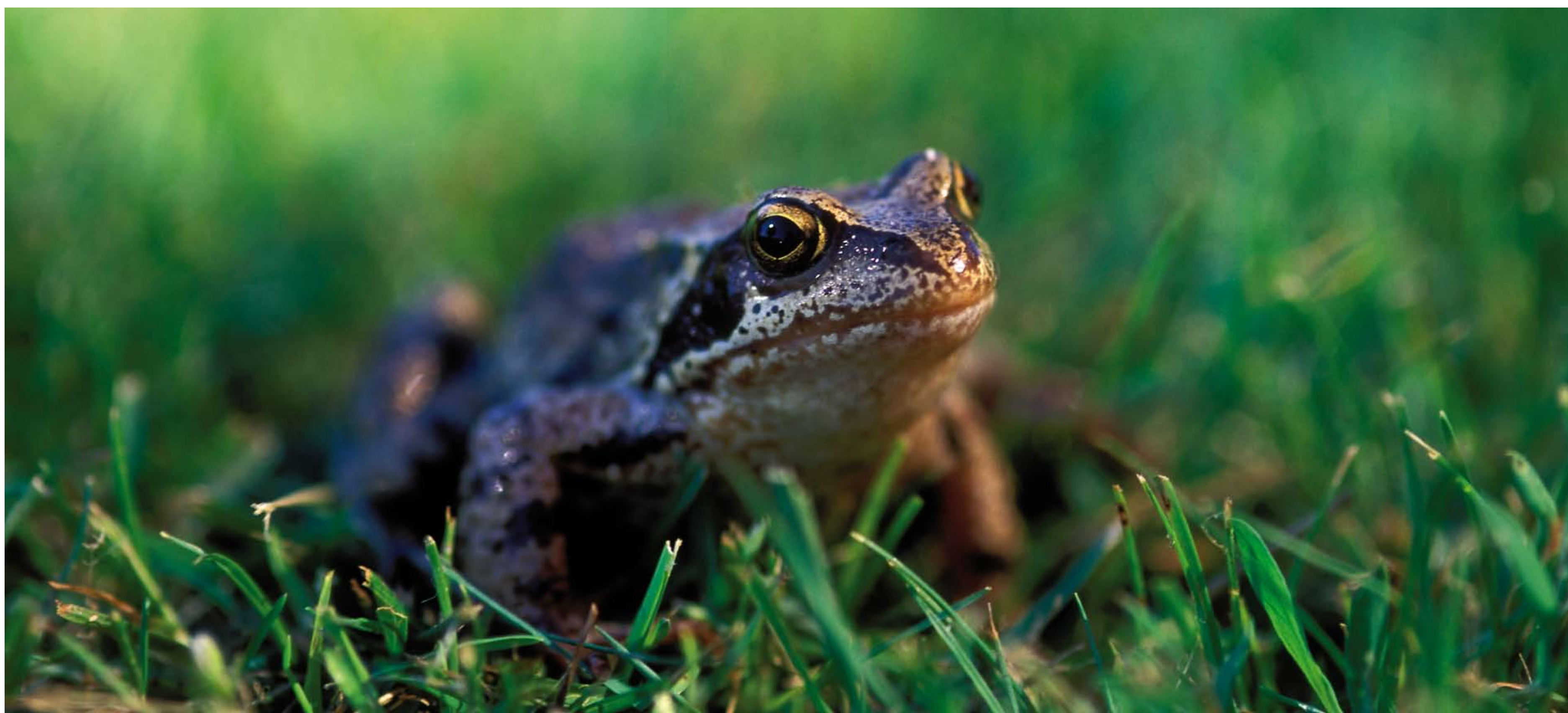
Vanlig groda, inte så vanlig som förr i tiden.

It's not easy being an amphibian these days, even though they are legally protected in Sweden. We humans have destroyed much of their habitat. So we look after the frog pond and other waters. We also leave heaps of stones and brush in the woods to serve as winter shelter.